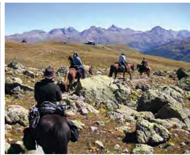
Auf Hufen statt auf Kanten und Kufen: Sommer im Skigebiet

– und sogar mit Kinderwagen – in etwa einer Dreiviertelstunde zu schaffen.