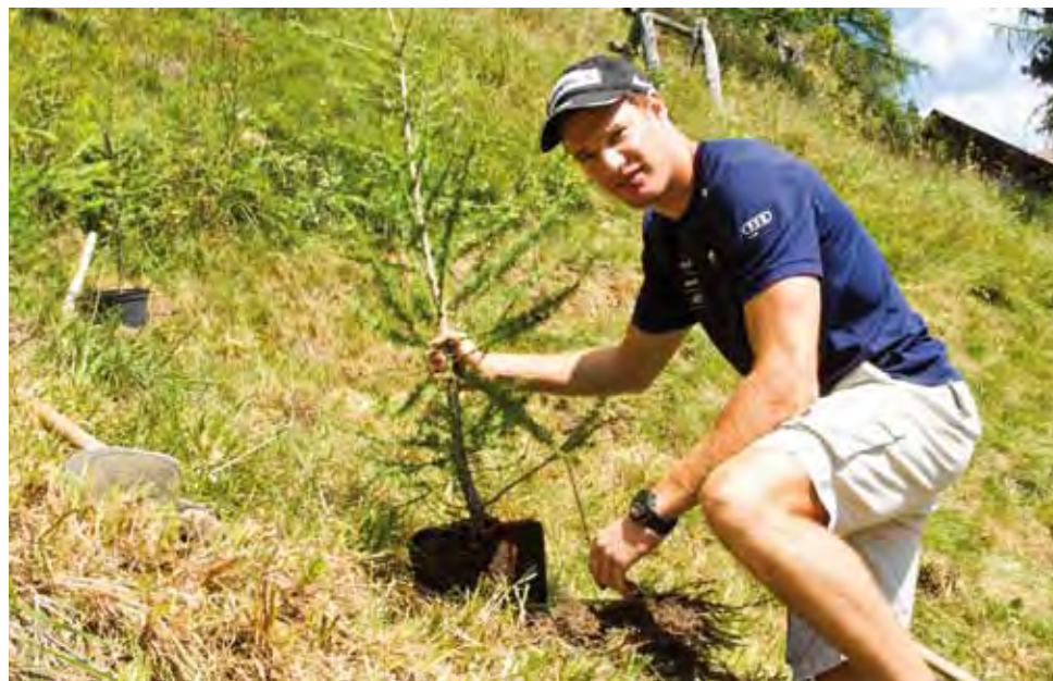
Dario Cologna beim Pflanzen der ersten Schutzwaldbäume