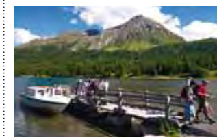
Schiff ahoi: der «Hafen» von Plaun da Lej am Silsersee

Auf 1800 Metern über Meer liegt der Silsersee, auf dem Europas höchstgelegene Kursschifflinie verkehrt. Während der 40-minütigen Rundfahrt zieht das Schiff vorbei an der Halbinsel Chastè, wo die berühmte Bank