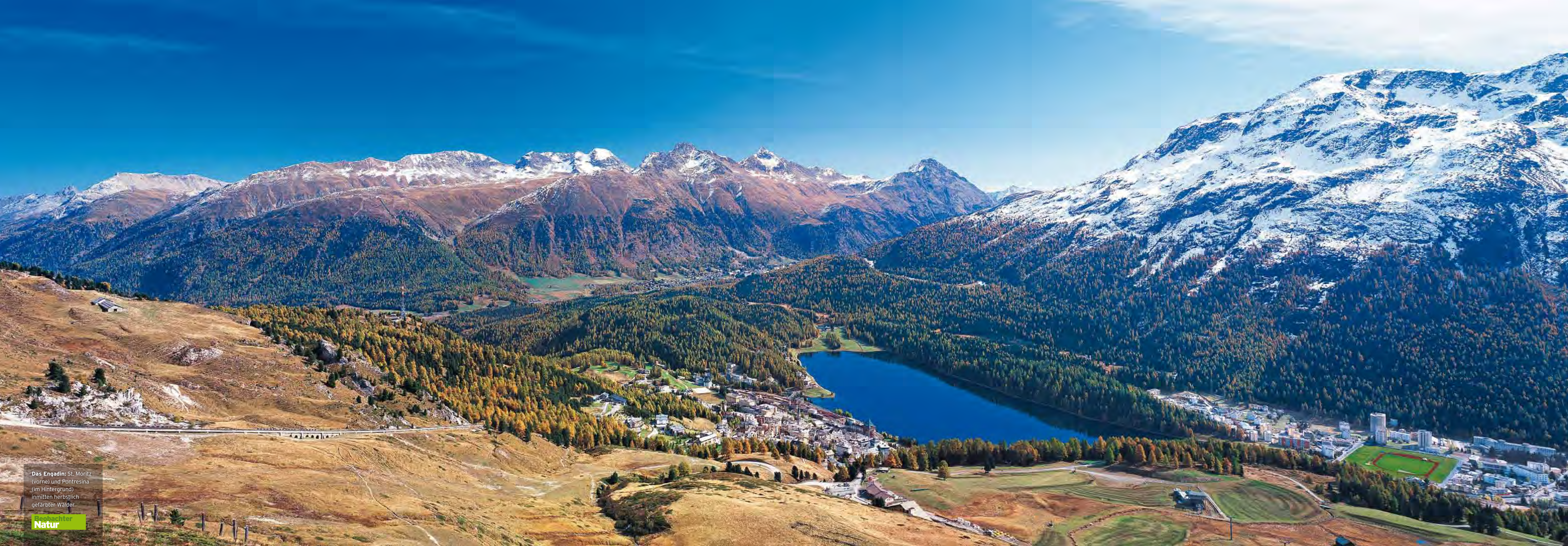
Das Engadin: St. Moritz (vorne) und Pontresina (im Hintergrund) inmitten herbstlich gefärbter Wälder