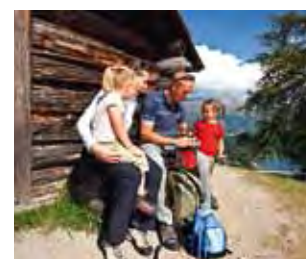
Bilderbuch-Idyll: die Heidi-Hütte am Schellen-Ursli-Weg

Der «Schellen-Ursli» ist eines der beliebtesten Schweizer Kinderbücher. Es erzählt von einem Knaben aus dem Engadin, der sich eine möglichst grosse Kuhglocke beschaffen will, um am traditionellen Umzug «Chalandamarz» ganz vorne mitlaufen zu können. Im Oberengadin gibt es einen Themenweg zur Geschichte. Er führt vom Hotel Salastrains oberhalb von St. Moritz durch den Schutzwald hinunter ins Dorf und ist auch mit Kindern